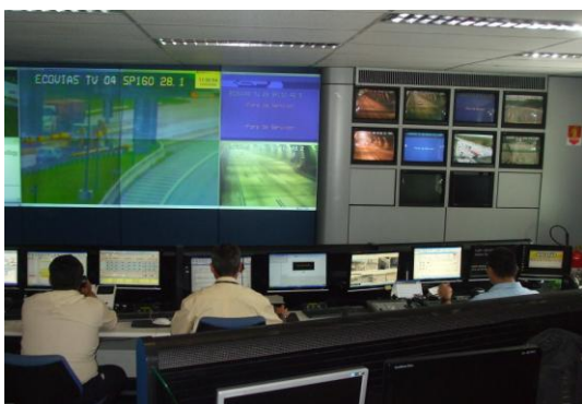
Figura 3 - Central de monitoramento

habilitada durante todo o período de funcionamento diário do túnel.