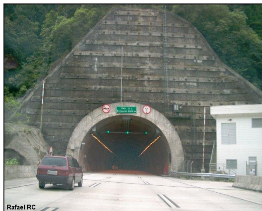
Figura 2 - Sinalização na entrada do túnel

5.9.1 Os túneis com extensão superior a 200 m devem possuir sistema de informação ao usuário quanto à ocorrência de acidentes, permitindo o desvio e evitando o acesso ao interior do túnel, podendo ser composto por luzes (verde ou vermelha), na entrada do túnel, em conjunto com sinalização escrita.