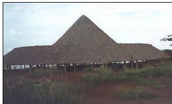
Figura 1 - Edificação de madeira com cobertura de fibras vegetais

5.1.3 A fiação que não estiver embutida em alvenaria ou concreto deve estar totalmente protegida por eletrodutos metálicos.