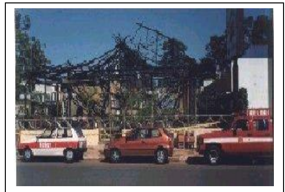
Figura 2 - Incêndio em edificação com cobertura de fibras vegetais (ocupação de bar e restaurante)

5.5.4 Recomenda-se a utilização de sistemas de aspersão de água que visam a manter as fibras permanentemente úmidas ou destinadas ao próprio combate das chamas, sem prejuízo das demais medidas constantes desta IT.