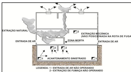
Figura 2 - Zonas mortas

b. extração adequada da fumaça, não permitindo a criação de zonas mortas onde a fumaça possa vir a ficar acumulada, após o sistema entrar em funcionamento (ver fig 2);